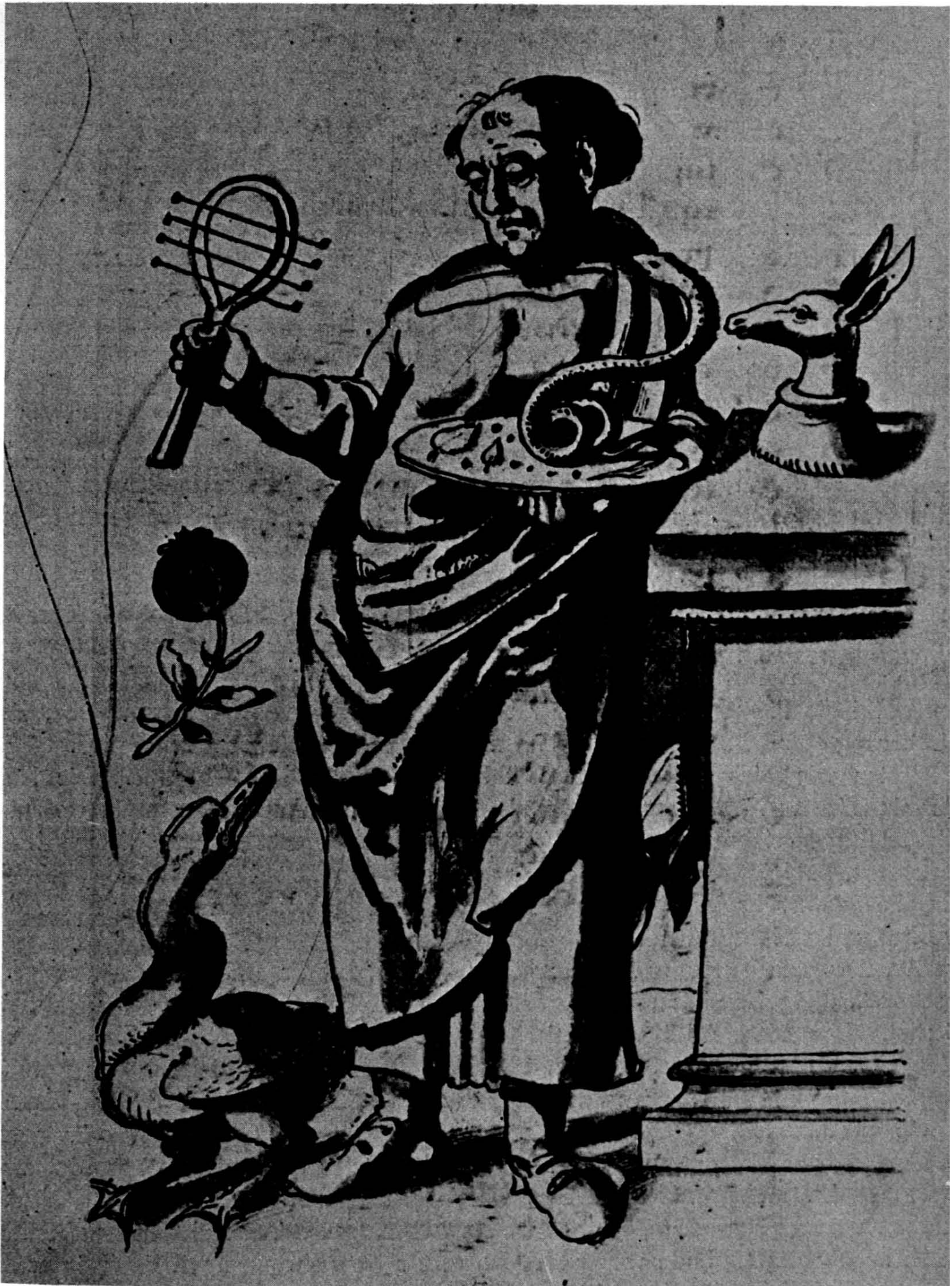
Fig. 1. Copie de Cranach l'Ancien (Vienne).