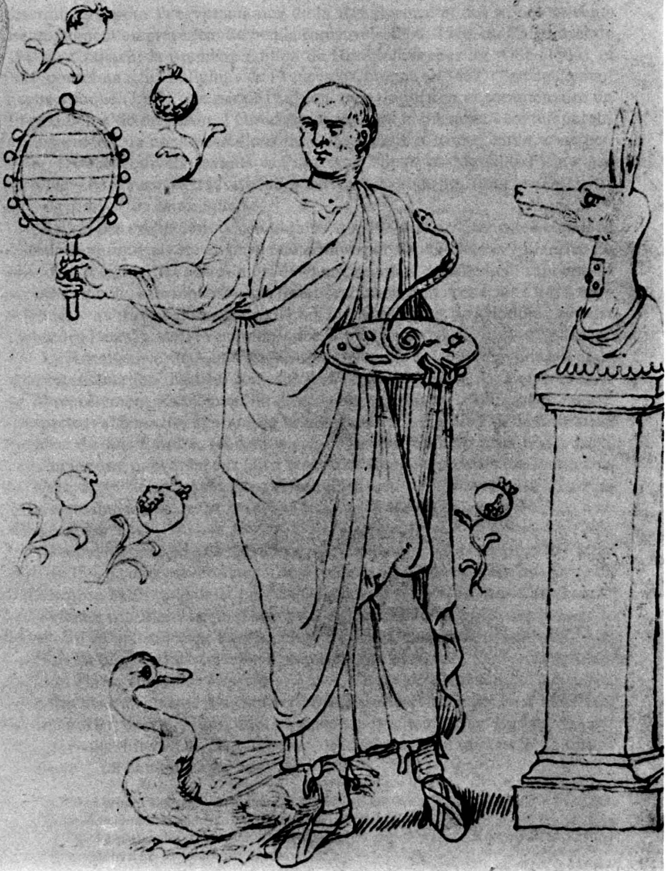
Fig. 3. Copie de Bruxelles.